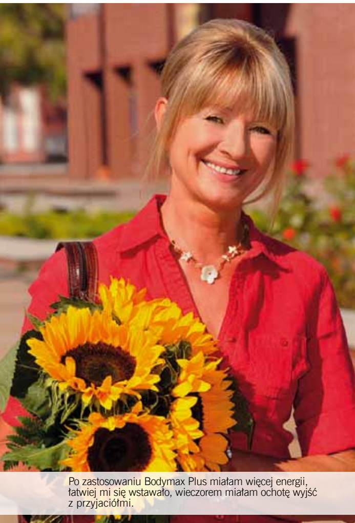
Po zastosowaniu Bodymax Plus miałam więcej energii, łatwiej mi się wstawało, wieczorem miałam ochotę wyjść z przyjaciółmi.